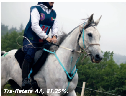
Tra-Rateta AA, 81.25%.