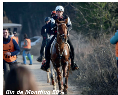
Bin de Montfluq 50%.